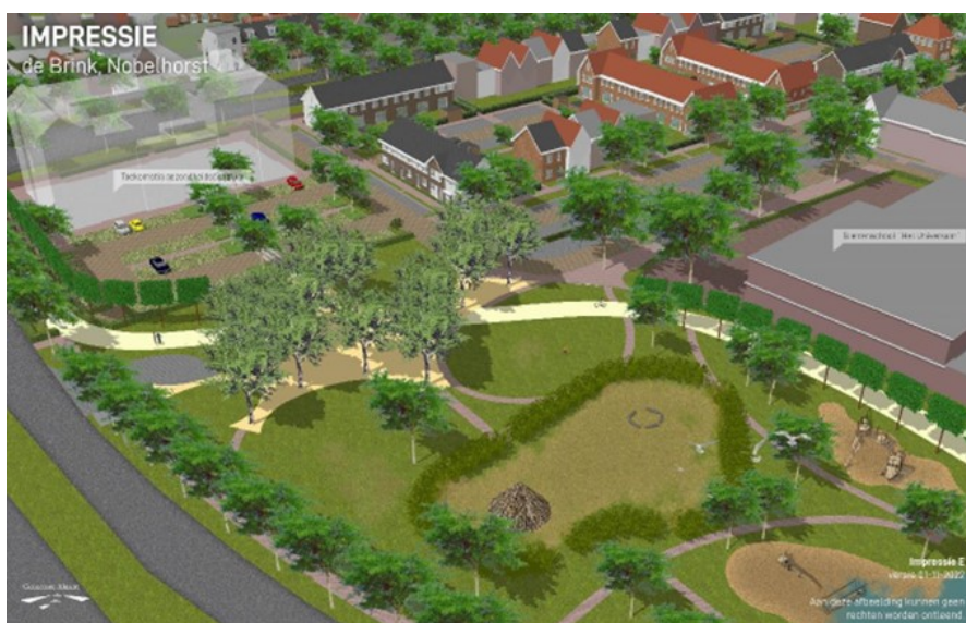
Afbeelding 2: Impressie van de nieuwe situatie. Het doorzichtige blokje in de linkerbovenhoek moet het nieuwe gezondheidscentrum voorstellen 4

Inmiddels is duidelijk wat er op het groene veld gaat komen: een gezondheidscentrum met onder meer een huisartsenpraktijk, een apotheek en zorgwoningen. De vier buurtschappen vinden dat zij onvoldoende zijn meegenomen in de besluitvorming rondom deze plannen. Zij willen dat het gezondheidscentrum ergens anders in Nobelhorst komt te staan of kleiner wordt. Om deze boodschap duidelijk te maken zetten de buurtschappen een petitie en een burgerinitiatief in de gemeenteraad op. Naar aanleiding hiervan onderzoekt de gemeente zeven alternatieve locaties voor het gezondheidscentrum en scoort deze op voor- en nadelen.